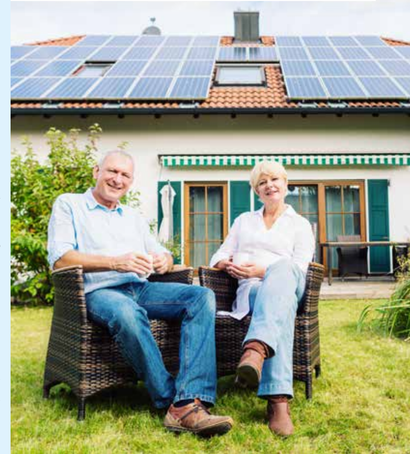
Stand: 10/2019 | Druck auf umweltfreundlichem, chlorfrei gebleichtem Papier.